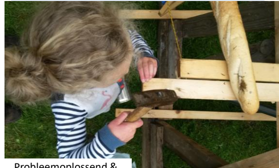
Probleemoplossend & Leervragen beantwoorden