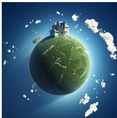
Introductie: boeiend onderwerp