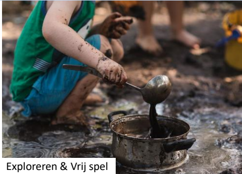
Exploreren & Vrij spel